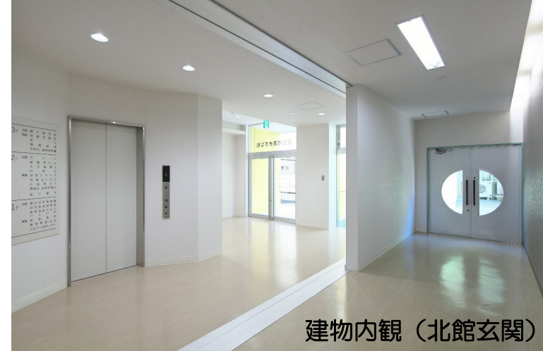
建物内観(北館玄関)