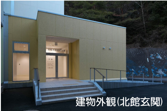
建物外観(北館玄関)