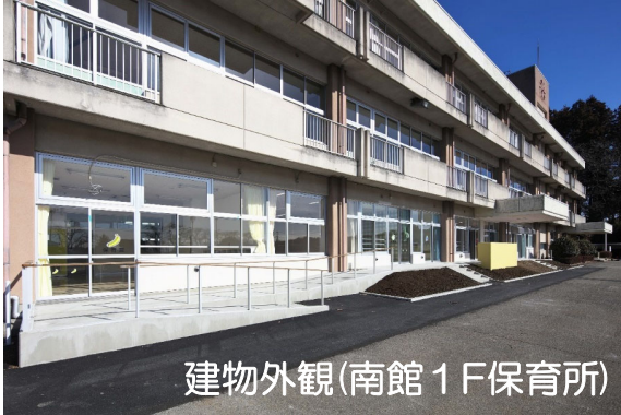
建物外観(南館 1F保育所)