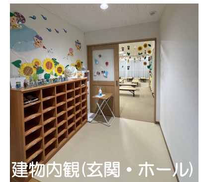
建物内観(玄関・ホール)