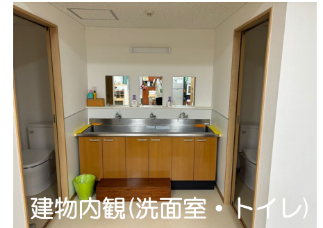
建物内観(洗面室・トイレ)