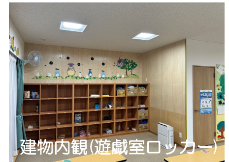
建物内観(遊戯室ロッカー)