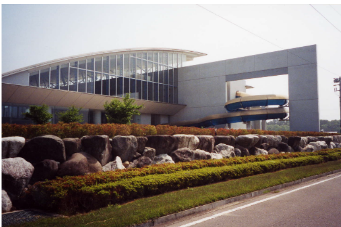
ガラスとコンクリートを大胆に用い、新たな空間を創出している。(芳賀町)