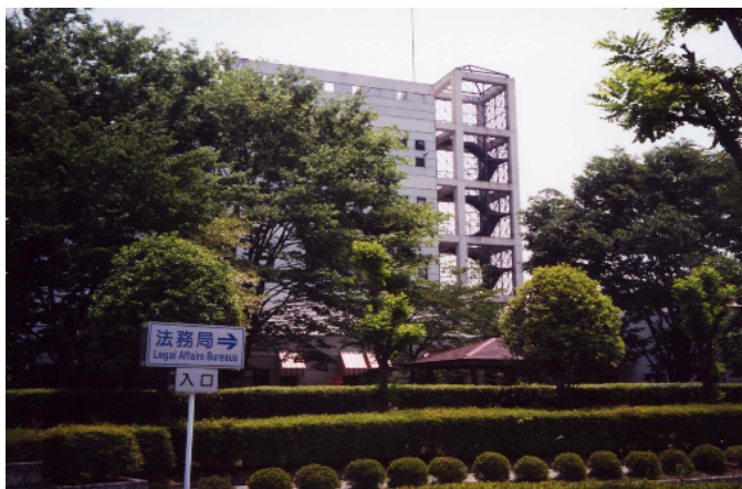
外階段を建築と一体的な躯体で囲い、見え方を工夫している。(鹿沼市)