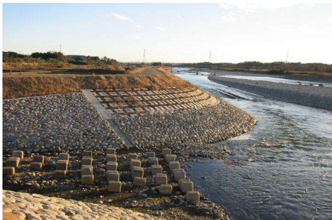
自然石をふんだんに使用した護岸によって、周辺の景観に調和させている。(塩原町)