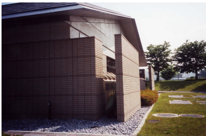
建築外壁と同じデザインの壁面を建て、雑然となりがちな室外機等を隠蔽している。(葛生町)