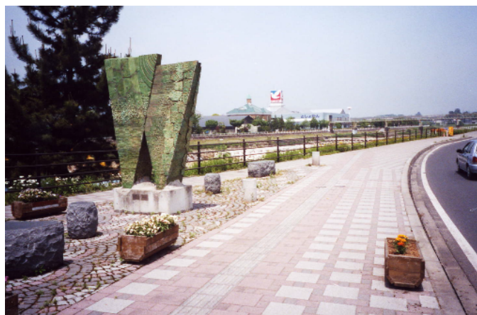
モニュメントのある橋詰広場から、川上澄生美術館や図書館などの施設が望める。(鹿沼市)