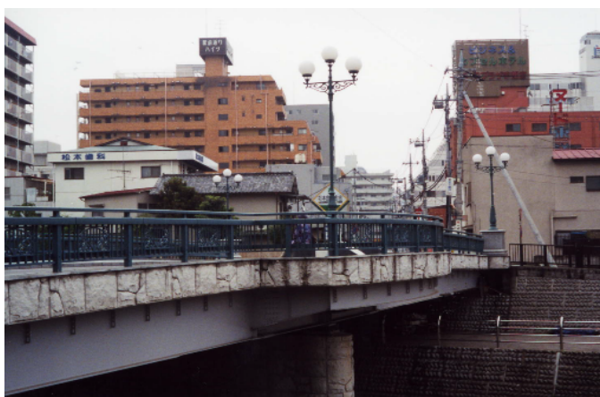
橋の中心にアルコーブを設け、眺望のできる憩いの空間を確保している。(宇都宮市)