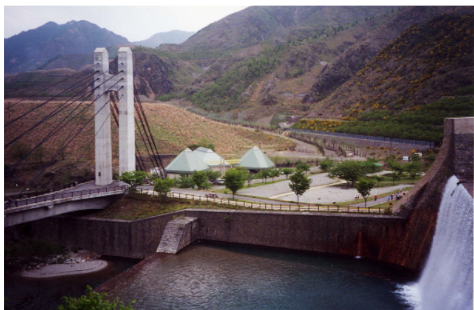
巨大な砂防ダムの迫力を享受することができる、銅親水公園。(足尾町)