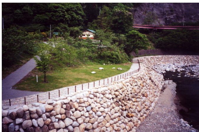
自然石工法による護岸によって、周辺の景観にとけ込ませている。(足尾町)