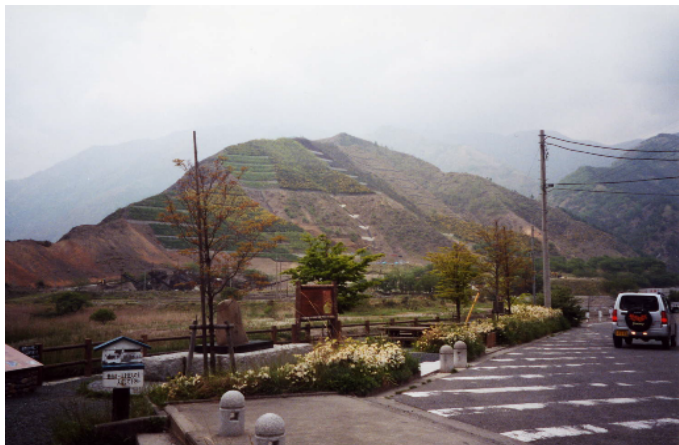
遠方に見える砂防ダムを一望できる、ポケットパークを整備している。(足尾町)