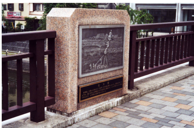
地域資源をレリーフにして高欄に設置し、歴史や文化を伝えている。(宇都宮市)