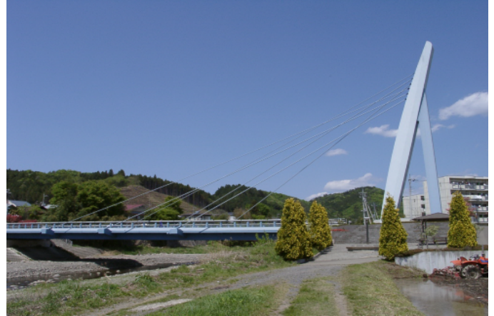
新たな景観を創造しつつ、背景となる自然に調和したシンボリックな斜張橋のデザイン。(馬頭町)