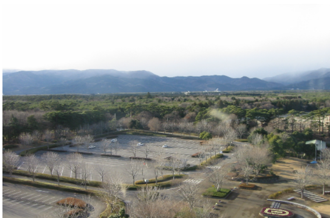
積極的に駐車場を緑化している。(西那須野町)