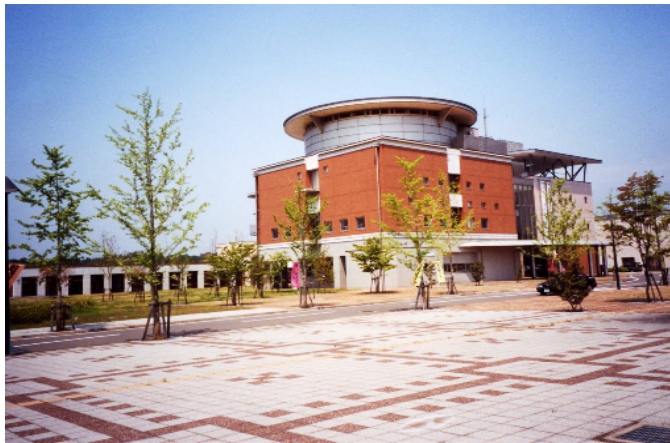
洗練された地域のシンボルとして、親しまれる庁舎のデザイン。(市貝町)