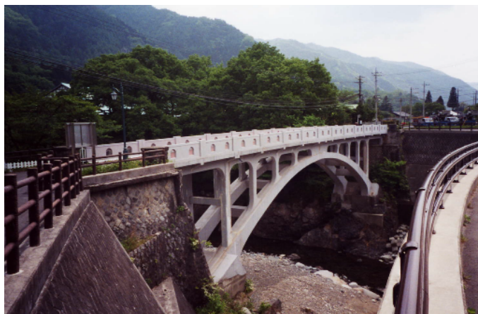
旧渡瀬橋の意匠を受け継ぎ、新たに整備した渡瀬橋。(足尾町)