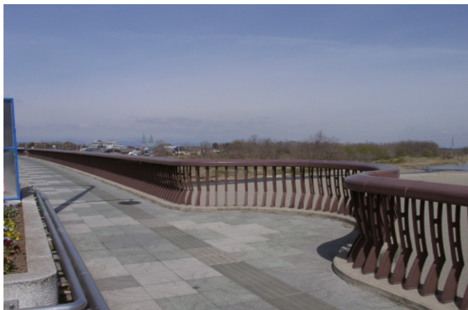
アルコーブを設け、新たな視点場を創出している。(小山市)