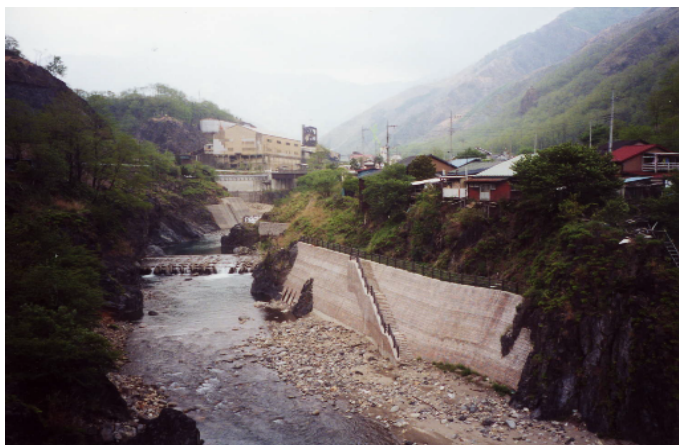
水辺まで降りていけるような、自然石による護岸を整備している。(足尾町)