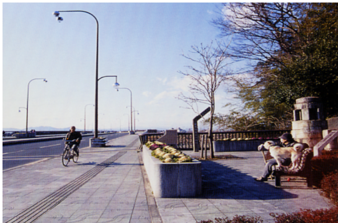
かつての橋梁の親柱を橋詰広場に保存し、橋梁の歴史を伝えている。(小山市)