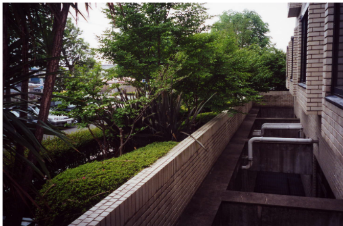
豊かな植栽帯の裏の、深く下に設置した設備類は、外からほとんど見えない。(宇都宮市)