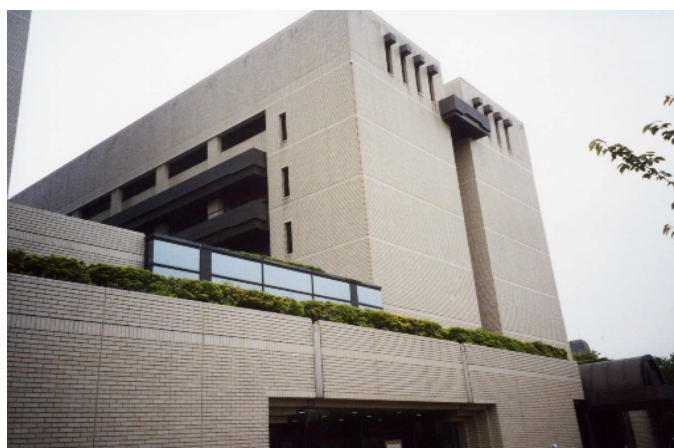
ベランダ緑化による緑が、単調となりがちな壁面に潤いを与えている。(宇都宮市)