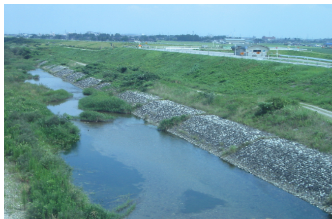
環境に配慮し、周辺景観に調和した、自然石による護岸改修。(富山県高岡市)