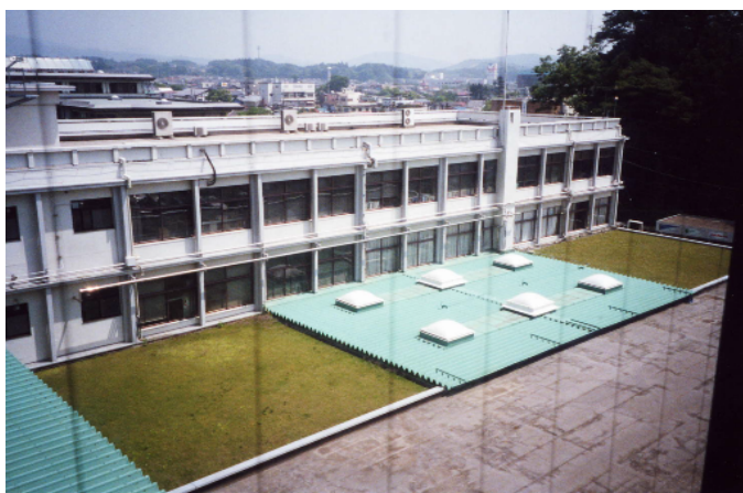
庁舎の屋根のわずかな空間ながら、芝を植えた屋上緑化を施している。(鹿沼市)