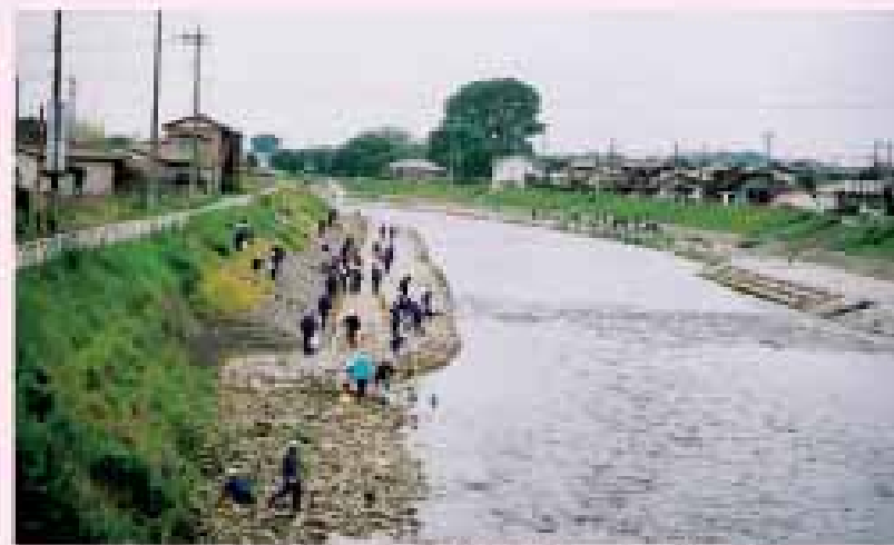
付近の小学校による河川愛護活動 五行川(真岡市)