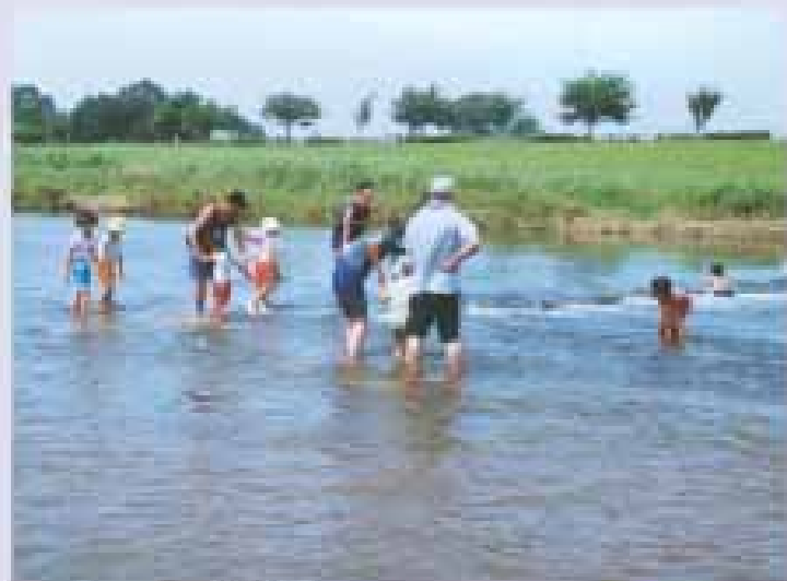
水辺の生き物のかんさつ