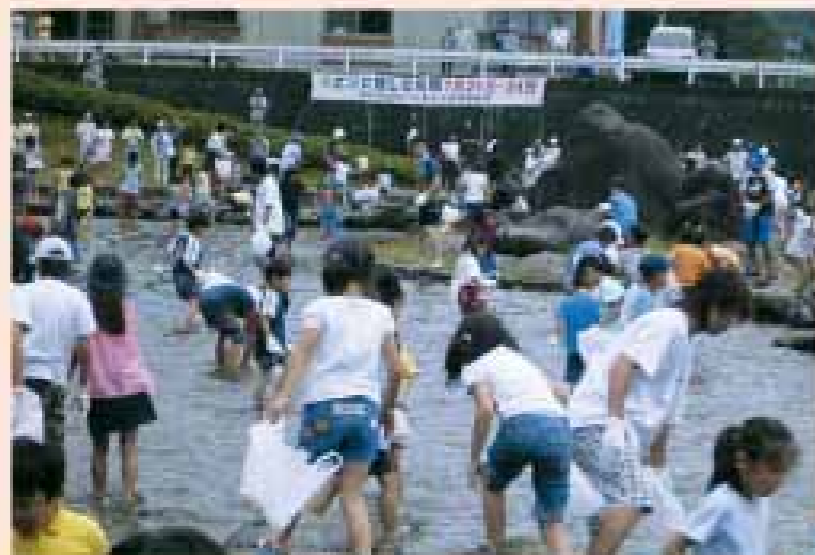
東荒川ダム(塩谷町)