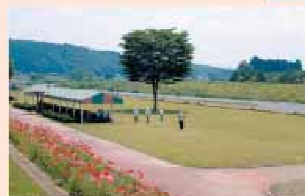
荒川 喜連川ジョイフル・ブルーパーク(さくら市)