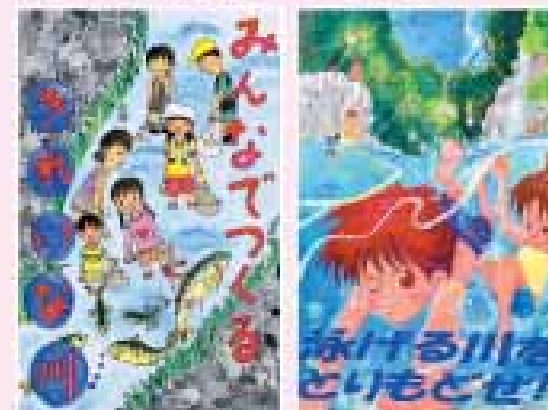
知事賞に選ばれた2作品

わたしたちがよごしてしまった川をきれいにするために、みんなで協力してごみひろいをしたり、川をきれいにする工夫をしています。