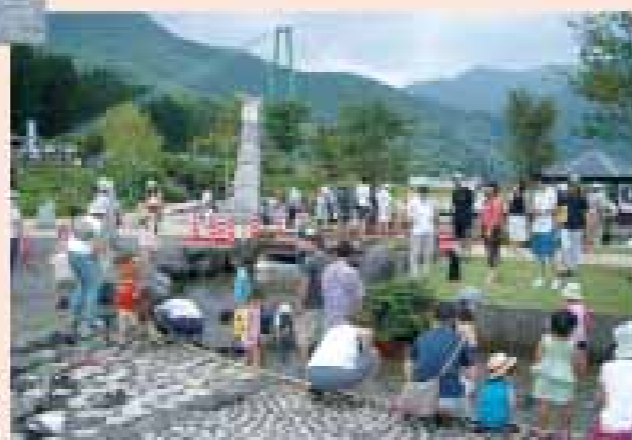
松田川ダム(足利市)