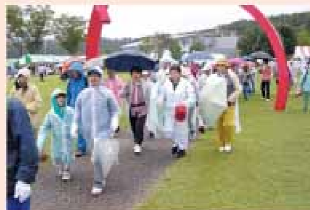
余笹川 雨のよささウォーク(那須町)