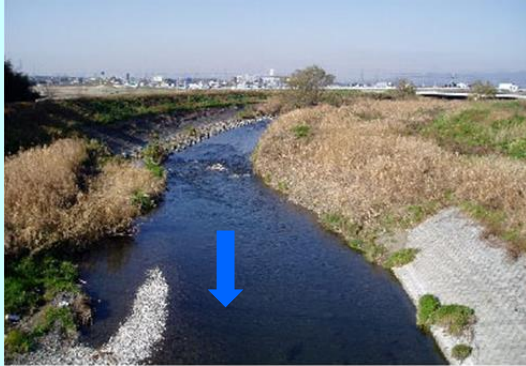
洪水のおそれがある川は