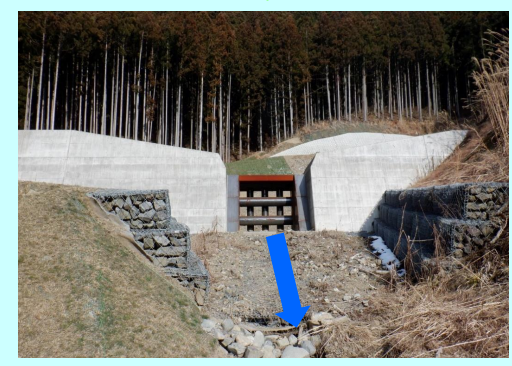
えん堤の整備を行って安全に