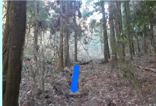
土石流のおそれがある溪流は