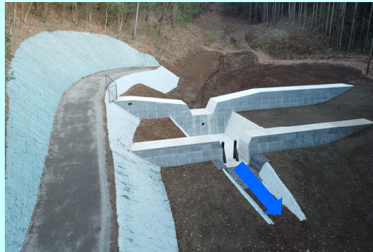
えん堤の整備を行って安全に