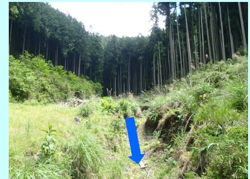
土石流のおそれがある溪流は