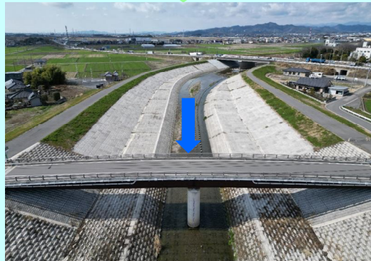
川を広げて安全に