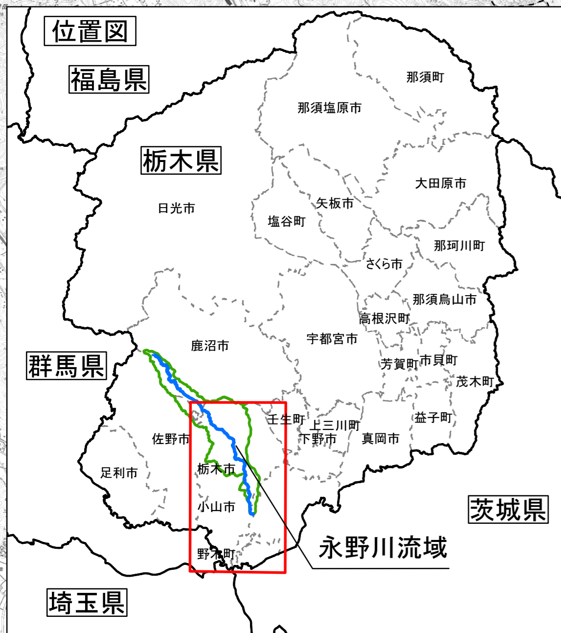
利根川水系永野川洪水浸水想定区域図 (家屋倒壊等氾濫想定区域(氾濫流))