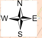
利根川水系永野川洪水浸水想定区域図(想定最大規模)