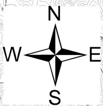
利根川水系巴波川洪水浸水想定区域図 (家屋倒壊等氾濫想定区域(氾濫流))