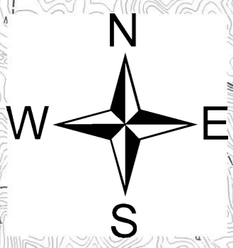
利根川水系巴波川洪水浸水想定区域図(計画規模)