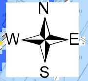
利根川水系巴波川洪水浸水想定区域図(浸水継続時間)