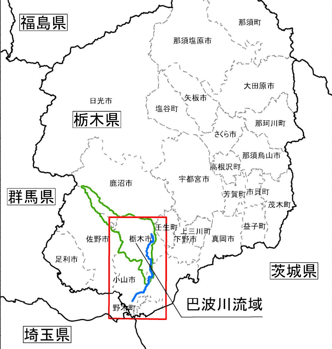
利根川水系巴波川洪水浸水想定区域図(浸水継続時間)