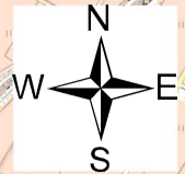
利根川水系巴波川洪水浸水想定区域図(想定最大規模)