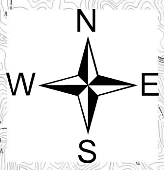
利根川水系巴波川洪水浸水想定区域図(想定最大規模)