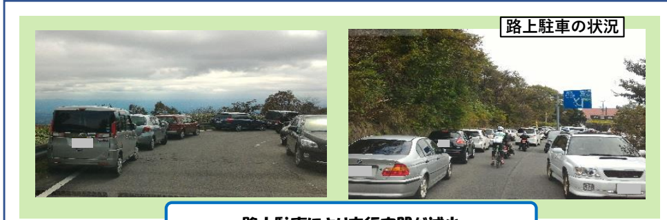
路上駐車により走行空間が減少