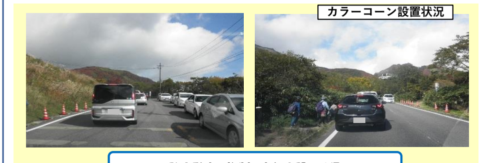
路上駐車を抑制し走行空間を確保