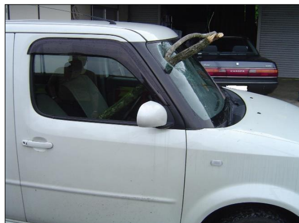
被害状況：落下した枝がフロントガラスを貫通

枯れている樹木や道路に張り出している樹木についての情報提供・御相談は、下記土木事務所の保全部にお願いします。