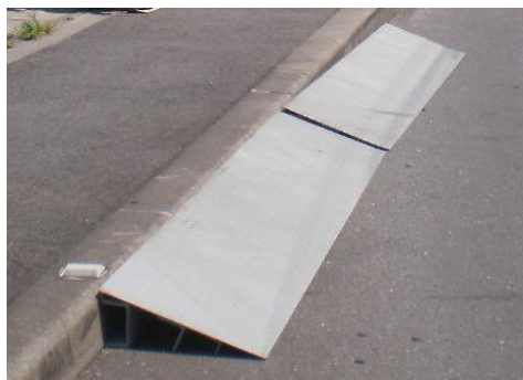
乗入(段差解消)ブロック