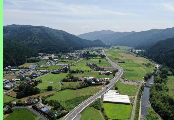
県道鹿沼足尾線 布施谷（鹿沼市）