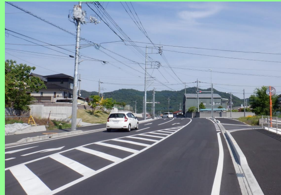
国道293号 助戸新山（足利市）