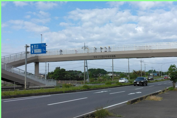
県道羽生田上蒲生線 寿町（壬生町）