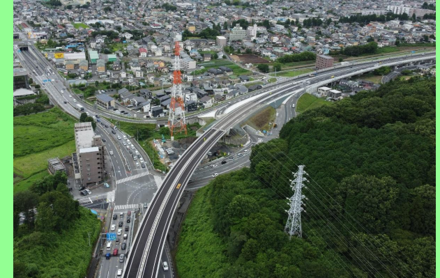
国道119号 上戸祭町（宇都宮市）