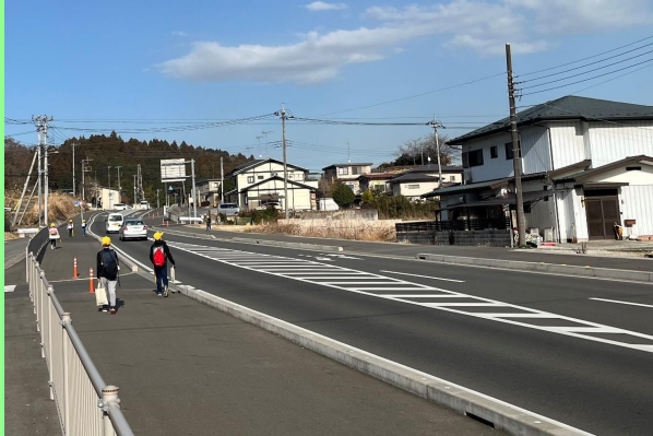
県道塩谷喜連川線 片岡（矢板市）