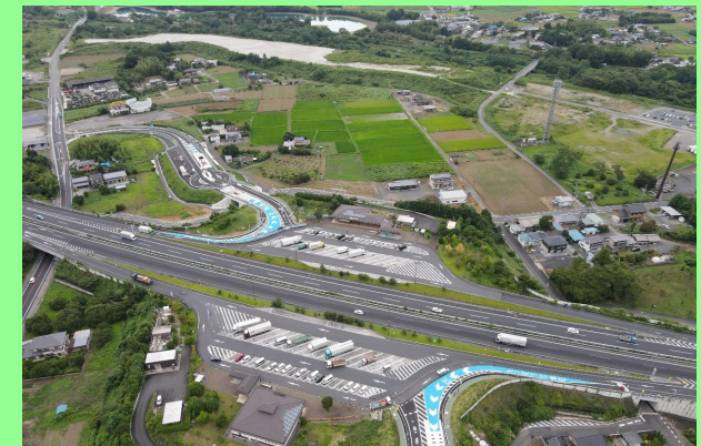
県道山形寺岡線 出流原（佐野市）