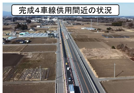
完成4車線供用間近の状況

問合せ先 栃木県土木整備部道路整備課 電話:028-623-2413 メール:doro-seibi@pref.tochigi.lg.jp 宇都宮土木事務所 整備部整備第3課 電話:028-626-3166 メール:utsunomiya-dj@pref.tochigi.lg.jp