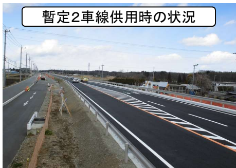
暫定2車線供用時の状況