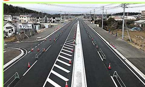
西三島にじいろ歩道橋から西側を望む