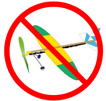
模型航空機の飛行 (ゴム動力機など)