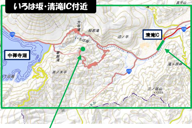
第2いろは坂 明智平駐車場 バスベイ設置