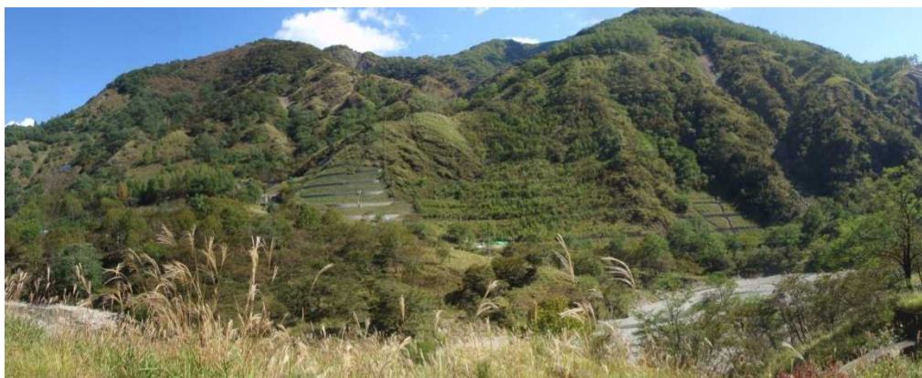
施工後 5 年経過

本事業完了後にボランティアの協力で植栽活動が行われ、現在では安定した植生状態となっている。