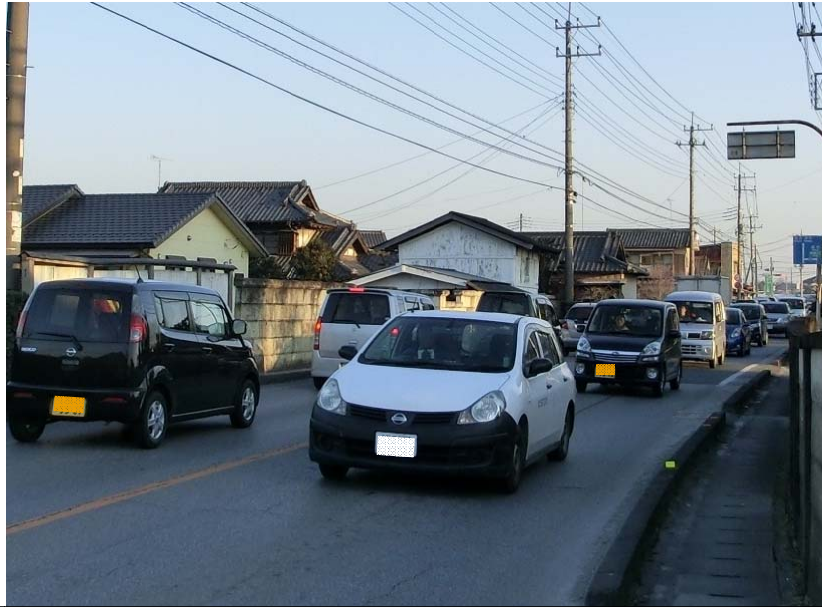
写真 1 : 橋本北交差点からの渋滞状況