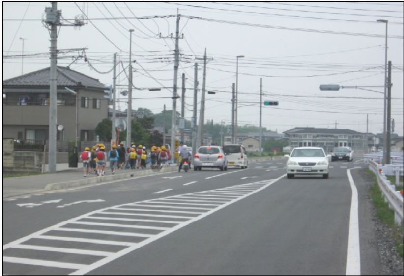
写真 2 : 暫定 2 車線供用状況 ( 1 期工区 )