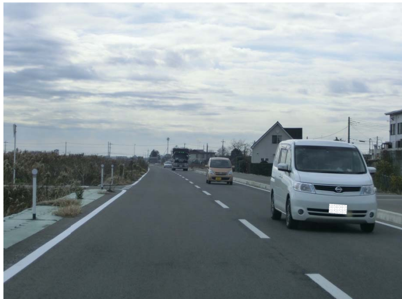
写真 3 : 暫定 2 車線供用状況 ( 2 期工区 )