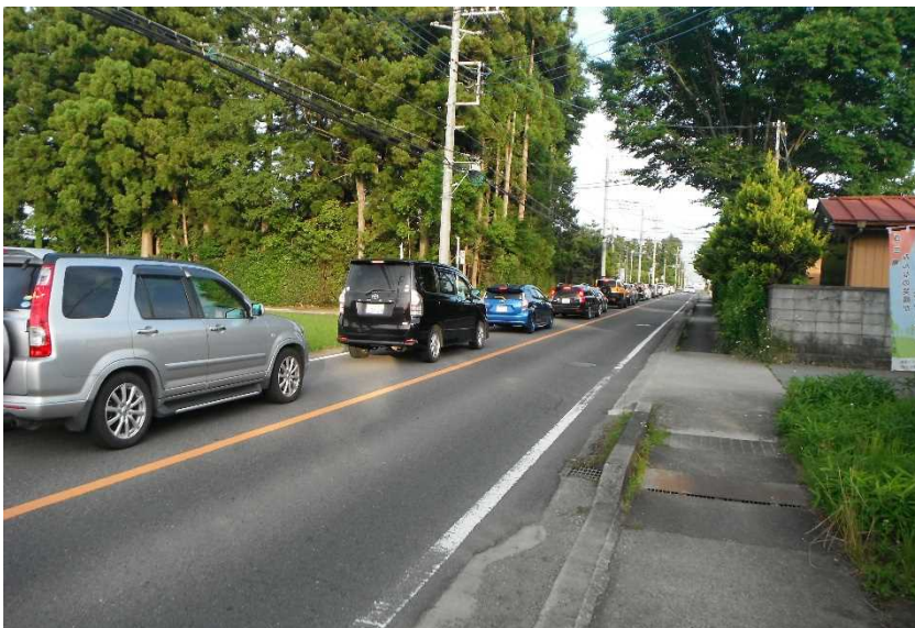
写真 2 : 現道の状況 (国道 4 号西那須野道路との交差点 : 東進)