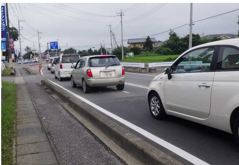
写真 3 : 現道の状況 (西赤田地内)