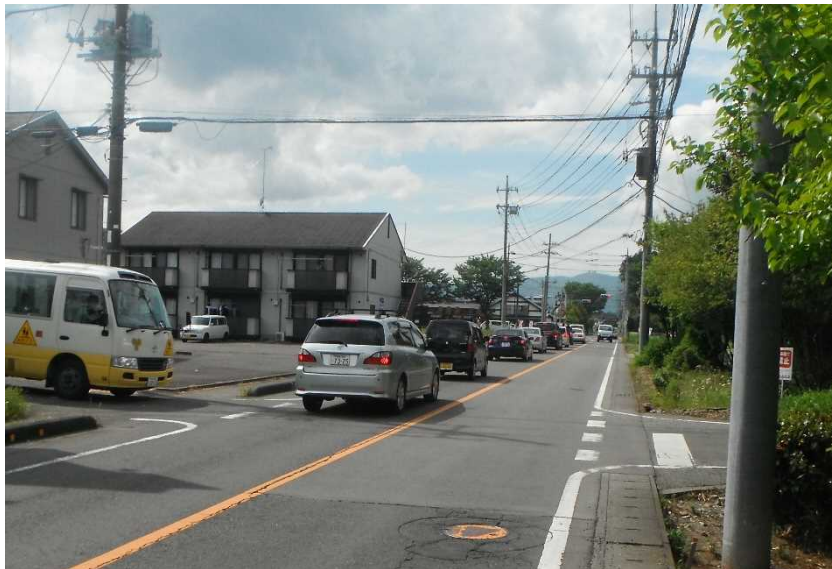
写真 1 : 現道の状況 (国道 4 号西那須野道路との交差点 : 西進)