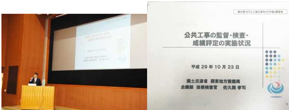
公共工事の監督・検査・成績評定の実施状況