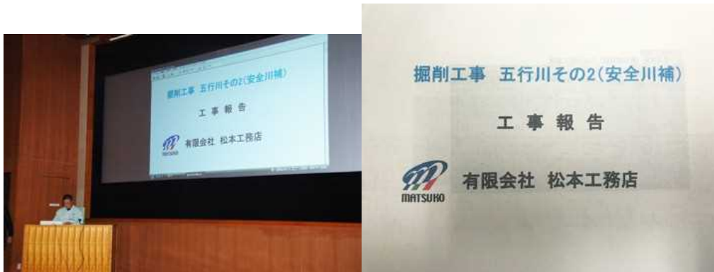
掘削工事 五行川その2 (安全川補)