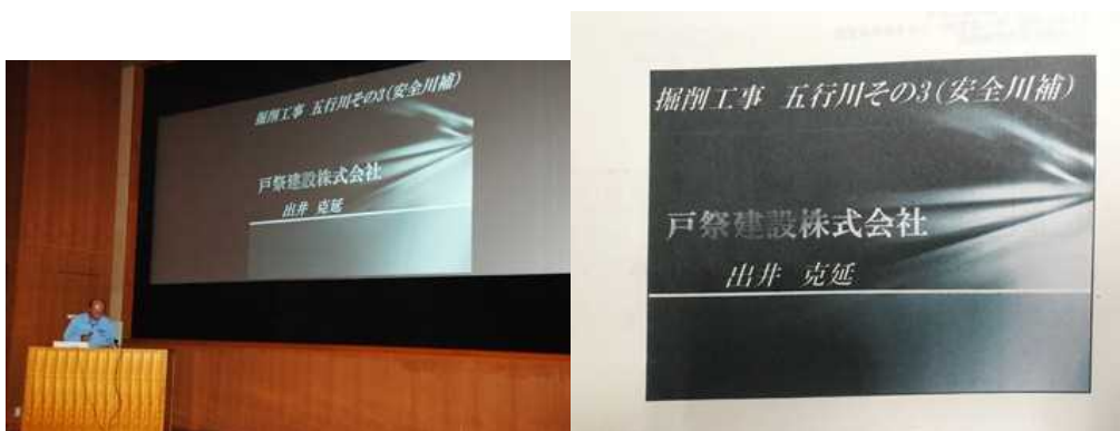
掘削工事 五行川その3 (安全川補)