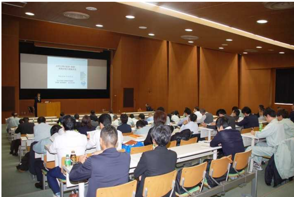
場所：栃木県庁研修館 講堂