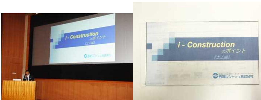
ICT土工に関する測量精度と 出来形・品質管理基準等について(1)