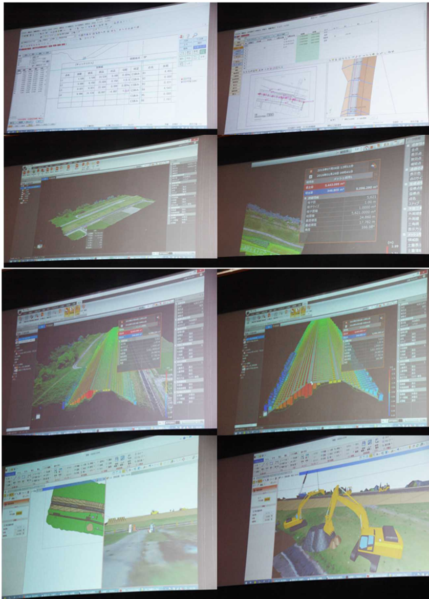
ソフトウェアの説明