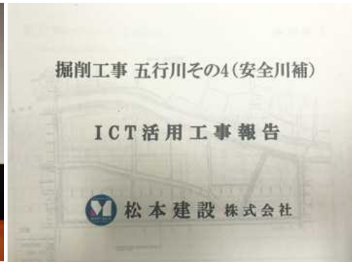
掘削工事 五行川その4 (安全川補)