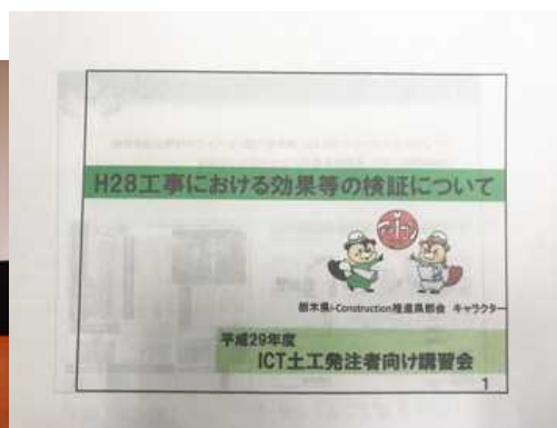
H28工事における効果等の検証