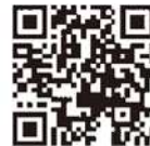
電子保証の仕組み