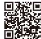
認証キーの取得方法 発注者への提出方法