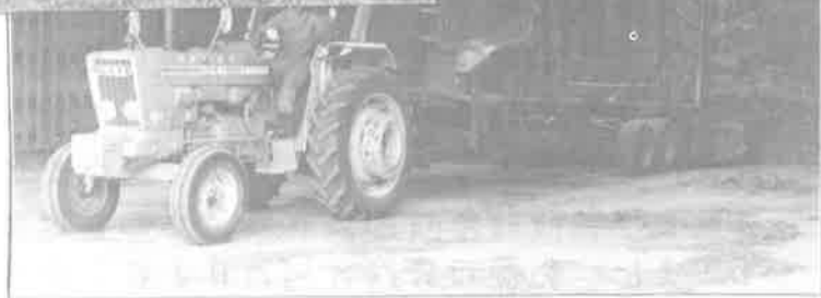
オートマチックボールワゴン