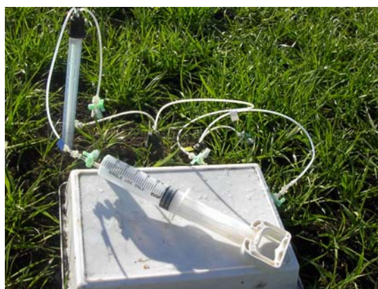
図2 土壌溶液採取装置