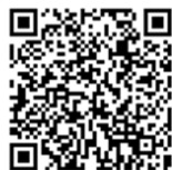
飼養衛生管理者研修動画