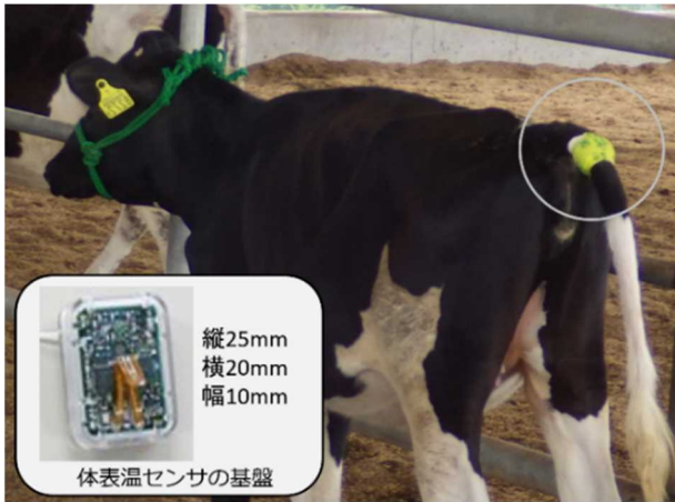
図1 体表温センサの装着状況