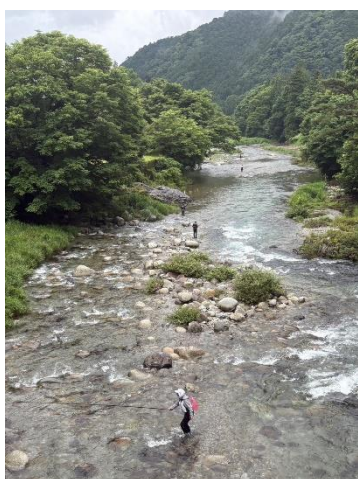
旧古澤林業付近での様子

【参考】過去の解禁日の平均釣れ具合 昨年(2025): 3.59尾、過去5年: 3.74尾