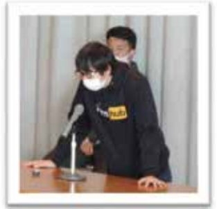
清き一票をお願いします！

今年はコロナウイルスの影響もあり残念ながら農大祭を行うことは出来ませんでした。が、地元地域住民の方も楽しみにいただいているので、来年度はパワーアップして開催していきたいと思っています。