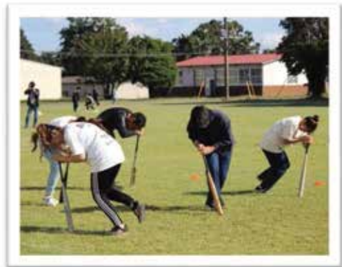
みんなで考えたスポーツ大会！爆笑ハプニング続出！？