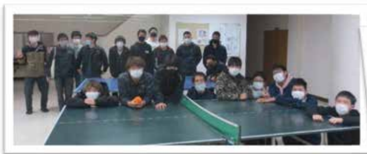
男子寮、集まれ！解散！