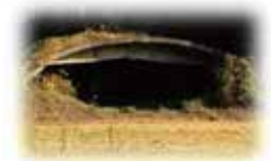
農大の敷地内にある「掩体壕」。戦時中は、ゼロ戦の格納庫に使われたとか。