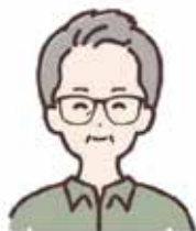
栃木県農業大学校 校長

あなたも、ぜひ、栃木県農業大学校で夢のある農業を学び、稼げる農業の実現をめざしてみませんか。