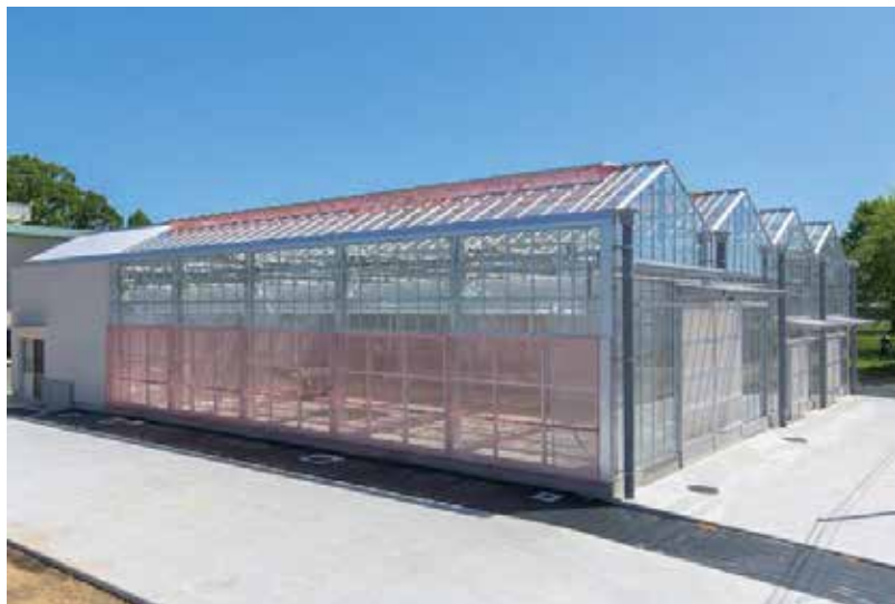
新設された次世代園芸育苗施設（令和2(2020)年3月完成）