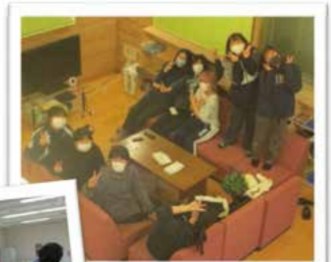
女子寮、集まって！はいチーズ！

今年はコロナの影響でバーベキュー大会など親睦を深める行事は行えていませんが、寮生1人1人が徹底した感染対策を行い毎日楽しく過ごしています。