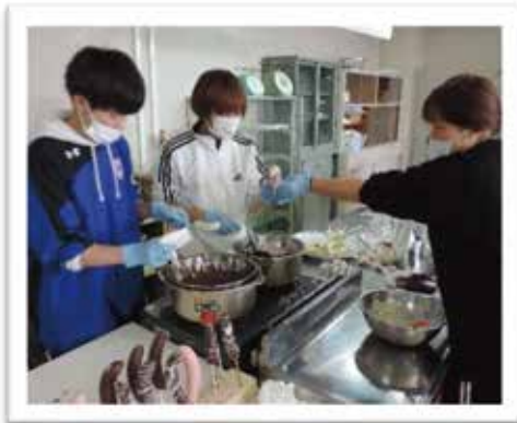
来年の農大祭ができますように！