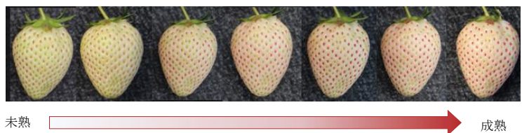
写真4 着色過程写真 (2月7日~13日) ※ 暖候期には桃色に着色する果実もみられる