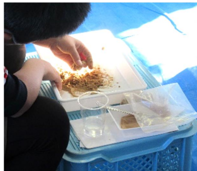
写真2 ピカピカの泥だんご作り