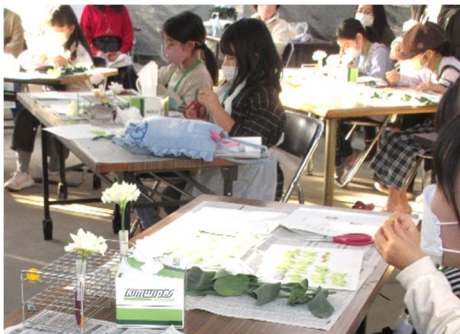
写真7 トルコギキョウの分解