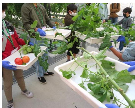
写真5 トマトの樹の重量測定