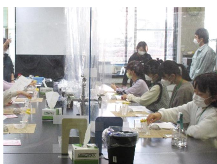
写真8 いちごのDNA抽出

写真1, 2 : 土とお米の世界コース 写真3, 4 : にっこり梨ととちぎの大麦コース 写真5, 6 : 野菜と虫の世界コース 写真7, 8 : 花とバイオの世界コース