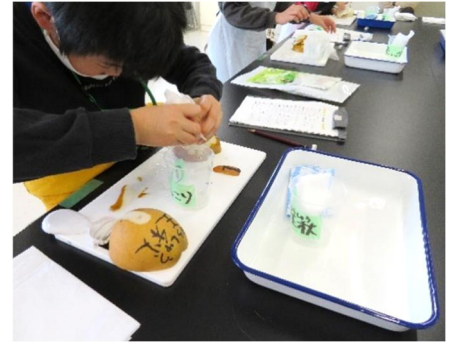
写真3 なしの糖度調査