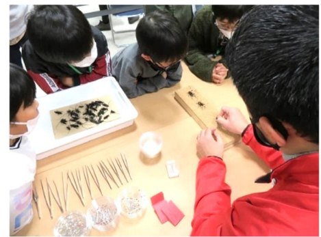
写真6 農業害虫の標本作り