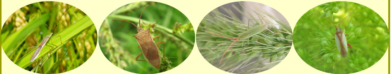
クモヘリカメムシ

斑点米カメムシ類（写真1）は籾を吸汁し斑点米を発生させます。わずかな斑点米の発生でも玄米の品質低下（等級落ち）を引き起こすため、水稻の重要害虫に位置づけられています。