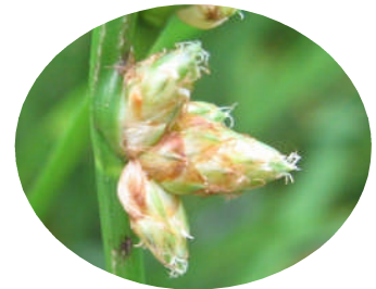
写真7 イヌホタルイの小穂

斑点米カメムシ類はイネ科植物の種子を好みます。水田内や水田周辺のイネ科雑草等は斑点米カメムシ類の誘引源、発生源、本田内へ侵入するための中継点になりますので、カメムシ類の生息しにくい環境を整え、斑点米の発生を防ぎましょう。