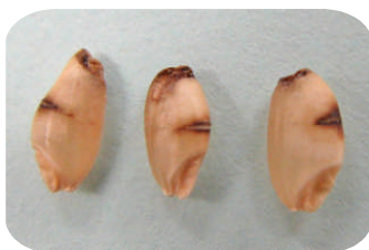
写真6 カメムシ黒点米