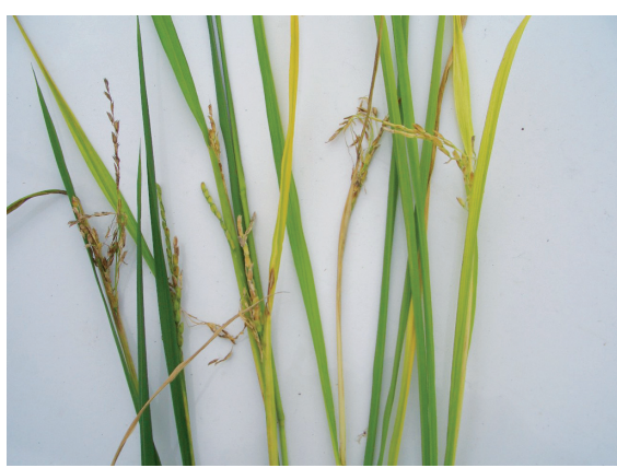
写真3 穂の出すくみ等