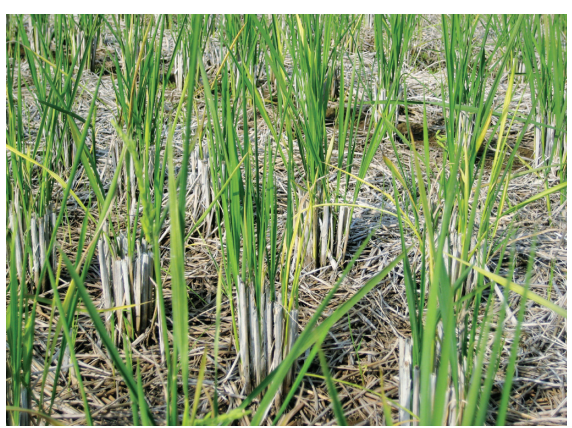
写真4 再生稲（ヒコバエ）の黄化