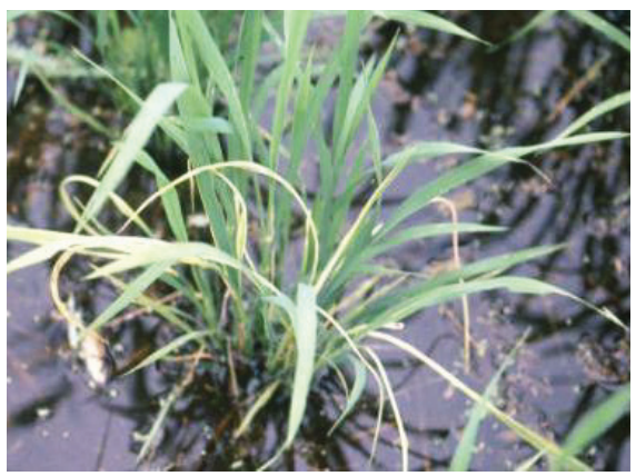
写真2 ゆうれい症状