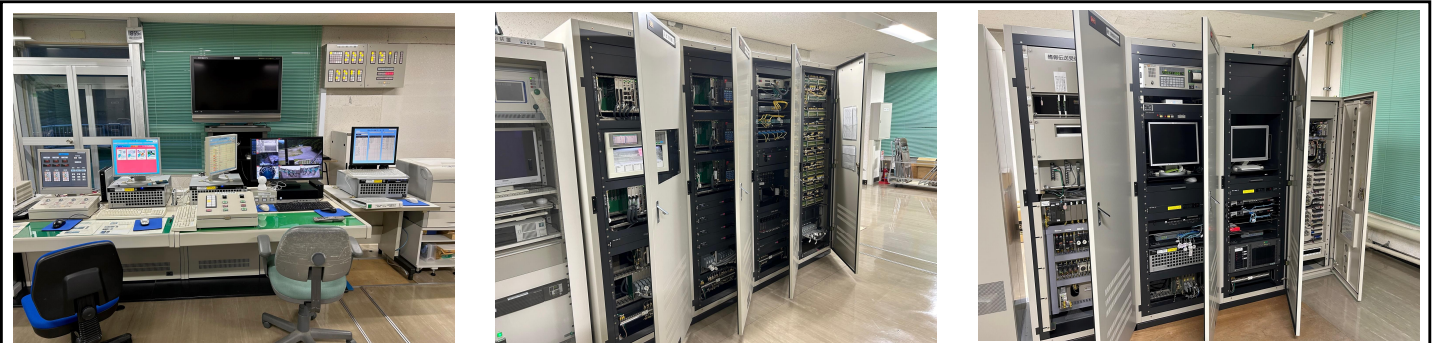
深山ダム管理棟 ダムコン