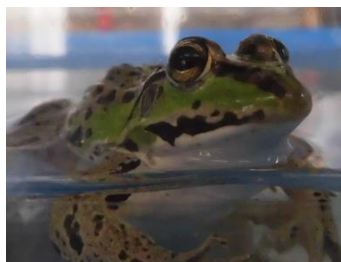
トウキョウダルマガエル