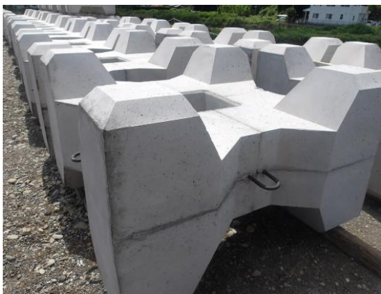
完成した根固めブロック