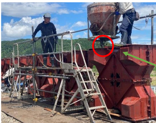
生コンクリート打設作業