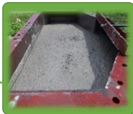
打設された生コンクリート