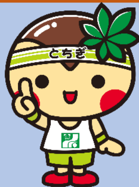
とちまるくん