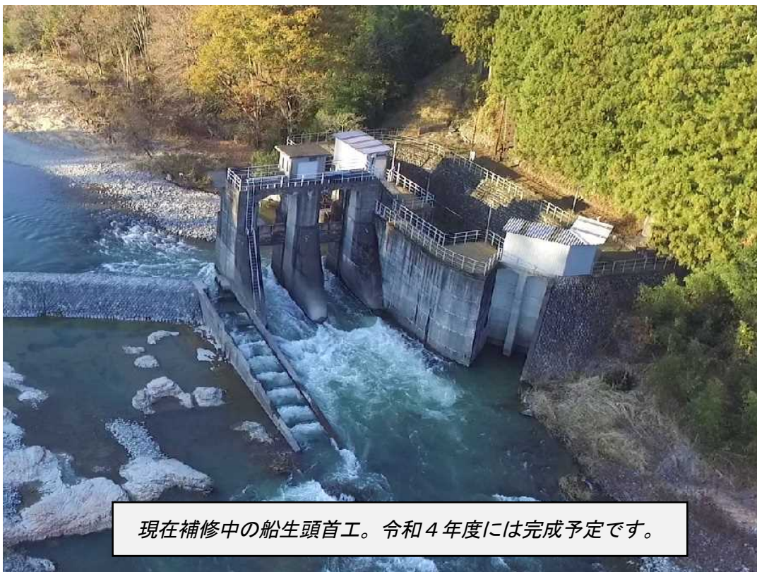
現在補修中の船生頭首工。令和4年度には完成予定です。