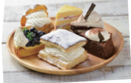
お米スイーツ&パン 各店舗による

【購入できる店舗】 朝日屋本店、金輪堂、ケーキのお店ジヨリー、cozuchi3302、mitsumame、イタリア食堂ヴェッキオ・トラム、ペーカリーいぶき、パン工房fū、MIMI BAKESHOP、Carnival(道の駅たかねざわ元気あっぷむら) 高根沢産の米や米粉を原料にして開発された、お米のヘルシーさを活かしたつづ美容にも配慮したスイーツ&パンです。