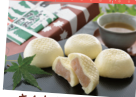
きんとんまんじゅう 1個 87円

【購入できる店舗】 朝日屋本店、朝日屋本店宝積寺バイパス店 明治30年創業の老舗和菓子店で作られた高根沢町の銘菓。白いんげんのつぶしあんで作ったお饅頭です。