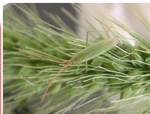
アカヒゲホソミドリカスミカメ

(2 回除草ができない場合は、 出穂期 10 日前まで に除草をすませましょ！)