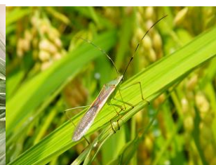
クモヘリカメムシ