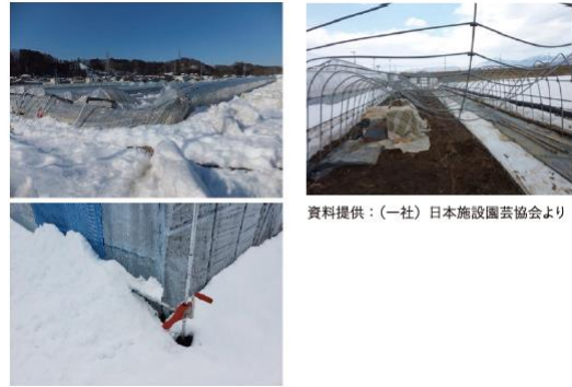
資料提供：(一社)日本施設園芸協会より

https://www.pref.tochigi.lg.jp/g04/kisyousaigai/ametaisaku.html