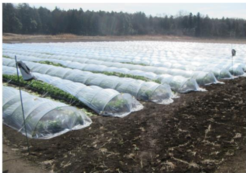
(水田に作付けされたレタス)