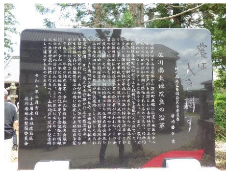
(土地改良事業の竣工記念碑)