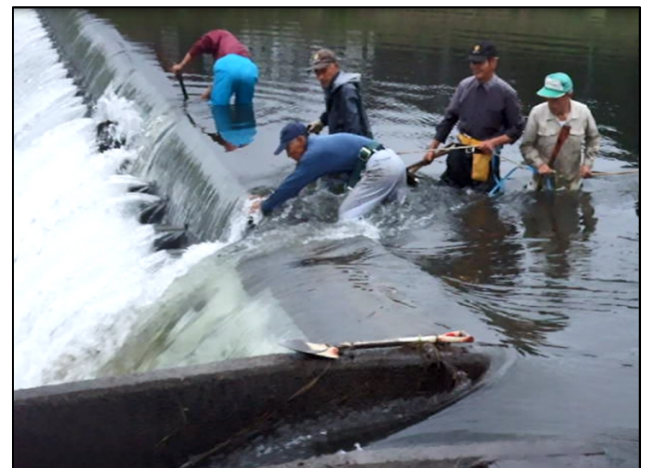
命綱をつけて堰板を倒伏させる様子