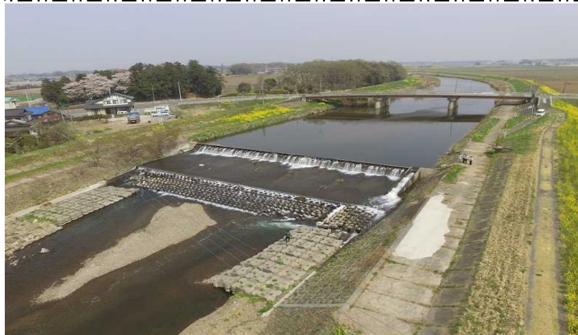
( 宮前堰の全景 )

本頭首工は昭和34年に築造され、これまで大規模な改修も行っていないことから、コンクリートの劣化や木扉の部分等の老朽化が生じており、農業用水の安定供給に支障をきたしている。そのため、安定した農業用水の確保と維持管理の安全確保・省力化を図るため施設の改修を図る。