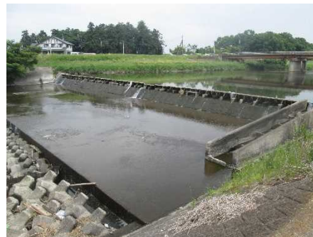
( 堰の様子 )