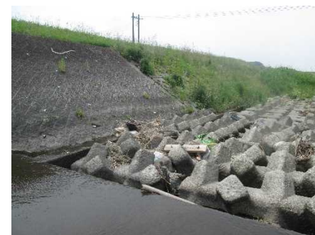
( 護床ブロック )