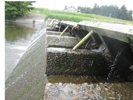
( 木製の扉体の様子 )