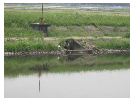
( 取水口の様子 )