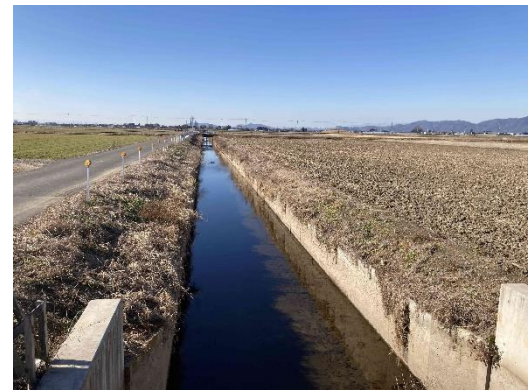
(西清水川支線排水路)