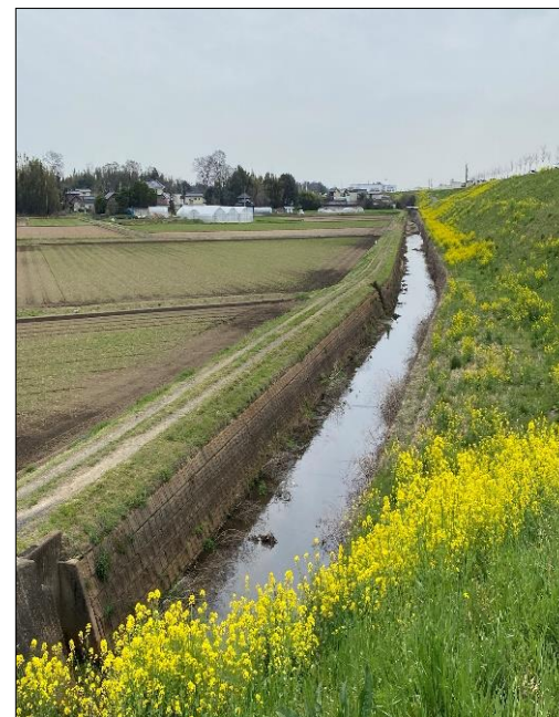
(整備前排水路 最下流部)