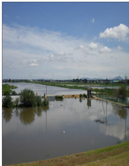
(令和台風時の様子)