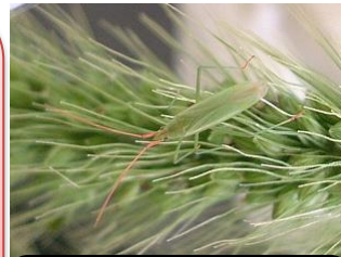
アカヒゲホソミドリカスミカメ