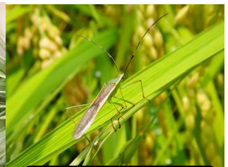
クモヘリカメムシ